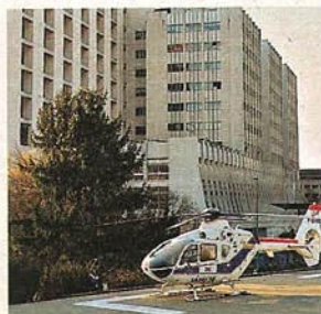
In dieser Klinik in Grenoble liegt Schumi

Schumi ist also offen für Spirituelles. Es bleibt zu hoffen, dass alle positiven Energien ihn erreichen und zusammen mit den Therapien der Ärzte ein Wunder geschehen lassen.